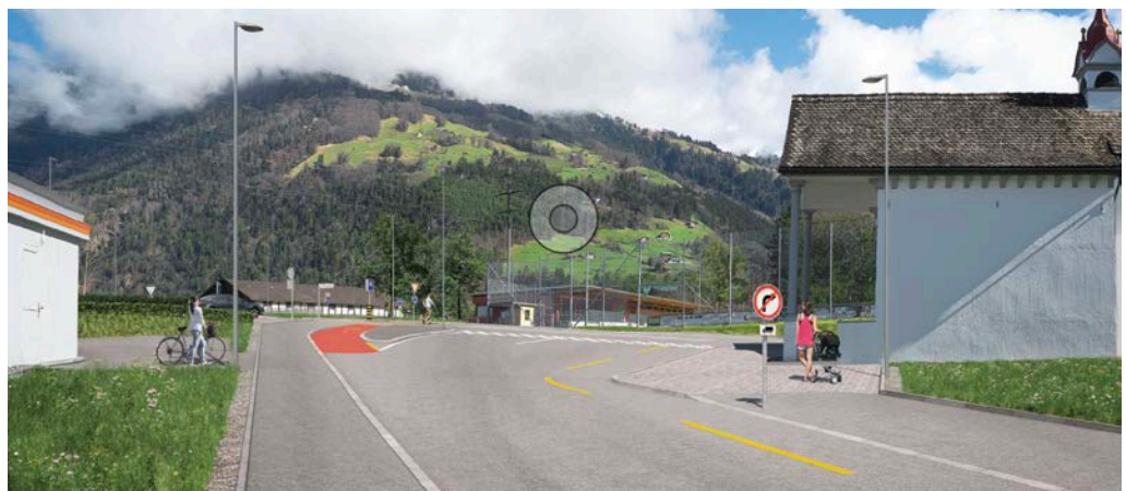
Die neu gestaltete Einmündung Gotthardstrasse/Dorfstrasse kann von allen gängigen Fahrzeugen befahren werden.

Die Prüfung mit der Auto AG Uri und der Transportgemeinschaft Uri hat gezeigt, dass Busse und Lastwagen den Kreisel Schächen problemlos befahren können.