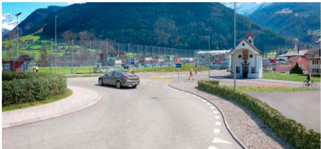
Ziel ist eine Verkehrs-entlastung von Schattdorf. Das wird mit dem dreiarmpigen Kreiselpunktschächten erreicht.

Ein vierarmiger Kreiselpunktschächten wäre machbar, allerdings braucht dieser erheblich mehr Land (Gefährdung Fussballplatz, Verlegung Kapelle, evtl. Gebäudeabbruch) und wäre damit viel teurer und in Anbetracht der Sicherheitsnormen nicht bewilligungsfähig.