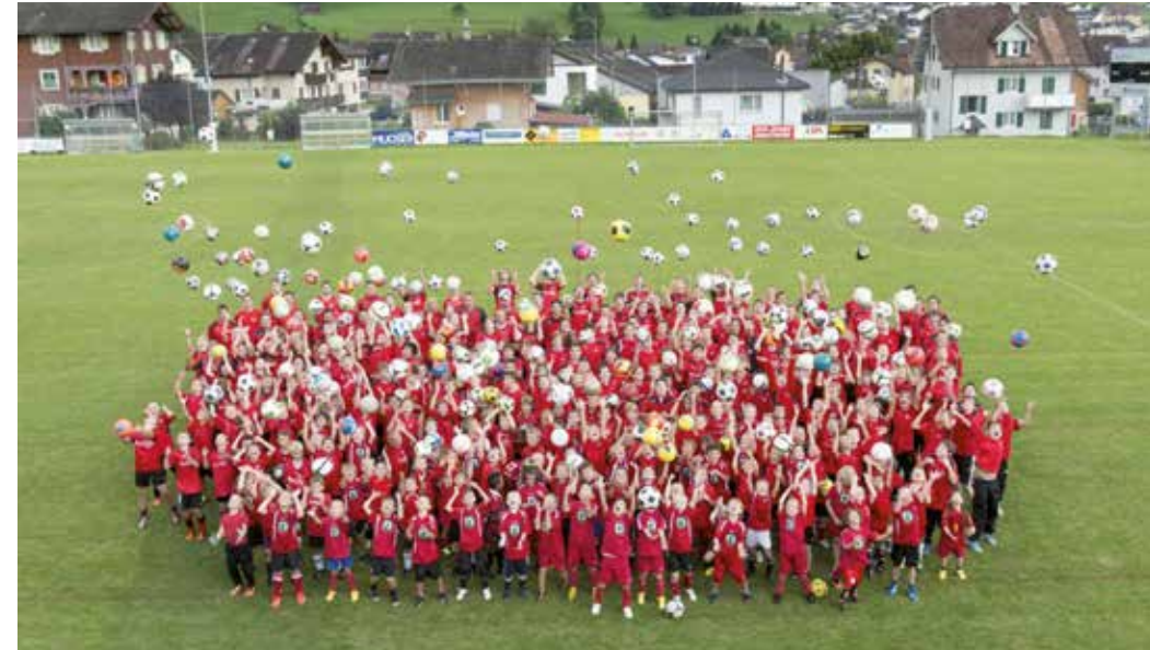
Der FC, der grösste Sportverein in Schattdorf.

Ein solcher Kunstrasenplatz der heutigen Generation kostet – selbst ohne grossen Schnickschnack – insgesamt rund 1,7 Millionen Franken. Neben der Hauptleistung, dem Kunstrasen an sich, sind es insbesondere der Unterbau, die Drainage, Bewässerung und die baulichen Anpassungen, die zu Buche schlagen. Weil der FC Schattdorf trotz der grosszügigen Unterstützung des Kantons mit 500'000 Franken und einer Eigenfinanzierung, die sich aus Sponsoringbeiträgen, Eigenleistungen und Fremdkapital zusammensetzt, nur einen Teil dieser Gesamtkosten stemmen kann, ist er auf die