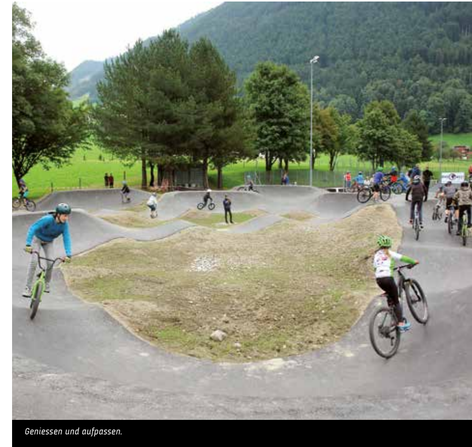
Geniessen und aufpassen.

Am 20. Juli erfolgte der Spatenstich. «Der Traum der Urbikers ist jetzt Realität», titelte die Urner Zeitung am 11. September 2017. «Dutzende Kinder und Jugendliche nahmen sogleich die Anlage in Beschlag und drehten unermüdlich ihre Runden.» Der neue Pumptrack lässt «Reifen höher hüpfen», schrieb das Urner Wochenblatt am 13. September 2017.