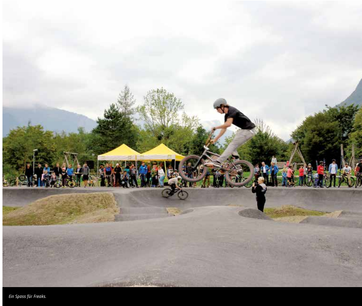
Ein Spass für Freaks.

Der Traum ist verwirklicht. Eine Initiative der Urbikers, eine neue Attraktion in Uri, ein Angebot in Schattdorf. Der Pumptrack begeistert Gross und Klein.