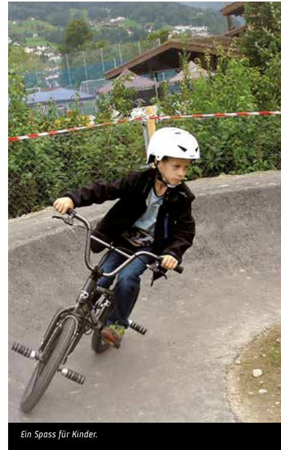
Ein Spass für Kinder.