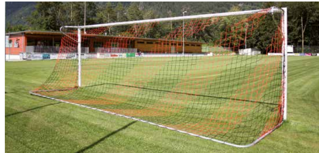
Fussballplatz Grüner Wald. Umstellen auf Kunstrasen bis im Winter 2018/19.

finanzielle Unterstützung der Gemeinde Schattdorf angewiesen. Das Begehren des FCS wird vom Gemeinderat aktuell behandelt. Möglich ist, dass die Schattdorferinnen und Schattdorfer am 4. März 2018 an der Urne über einen Kredit für die Umrüstung des Fussballplatzes Grüner Wald abstimmen werden. Mit einem Ja zu diesem Beitrag wäre es dem FC Schattdorf nicht nur möglich, den zukünftigen Trainings- und Meisterschaftsbetrieb zu sichern, sondern auch wachstumsfähig zu bleiben und so der von der Gemeinde angestrebten Entwicklung Schattdorfs als «anziehende Wohngemeinde und attraktiver Arbeitsstandort» Rechnung zu tragen.