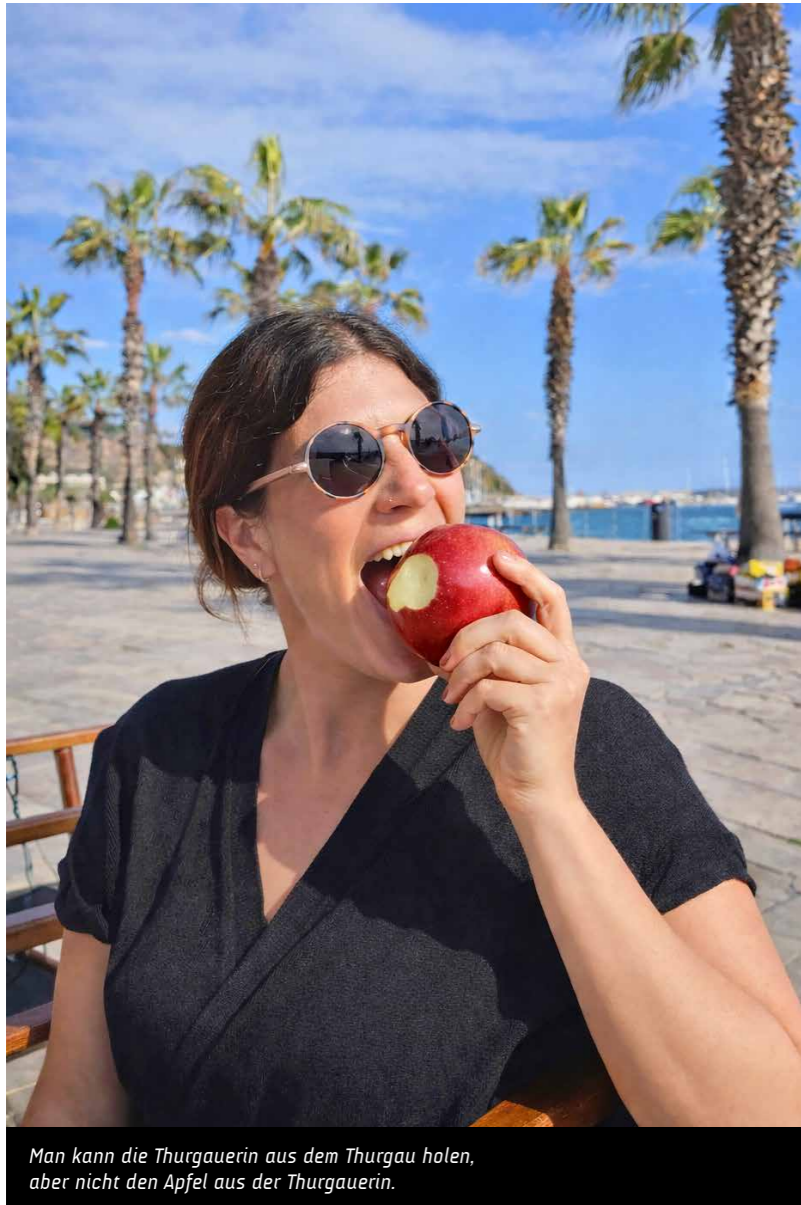
Man kann die Thurgauerin aus dem Thurgau holen, aber nicht den Apfel aus der Thurgauerin.

«Furrer» werde ich wohl noch einige Male wiederholen müssen. Mein Thurgauerdialekt ist auch in der Einwohnerkontrolle nicht zu überhören. Nach anfänglichen Sprachbarrieren und dem einen oder anderen augenzwinkernden Kommentar hat sich inzwischen auch der letzte Mitarbeitende daran gewöhnt. Heute gehört mein Dialekt genauso zum Arbeitsalltag wie das freundliche «Grüezi» am Empfang.