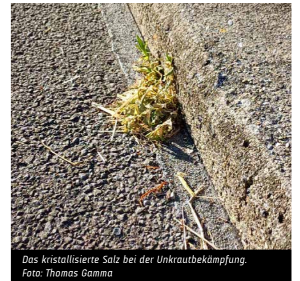
Das kristallisierte Salz bei der Unkrautbekämpfung.

stoffverbrauch rund 85 Prozent geringer. Dadurch entstehen deutlich weniger CO 2 -Emissionen. Auch aus Sicht der Biodiversität schneidet die Methode besser ab. Während bei Heisswasserbehandlungen häufig Ameisen, Insekten und andere Kleinstlebewesen durch die Hitze getötet werden, wirkt Sole in erster Linie auf die Pflanzenoberfläche und hat deutlich geringere Auswirkungen auf das Bodenleben.»