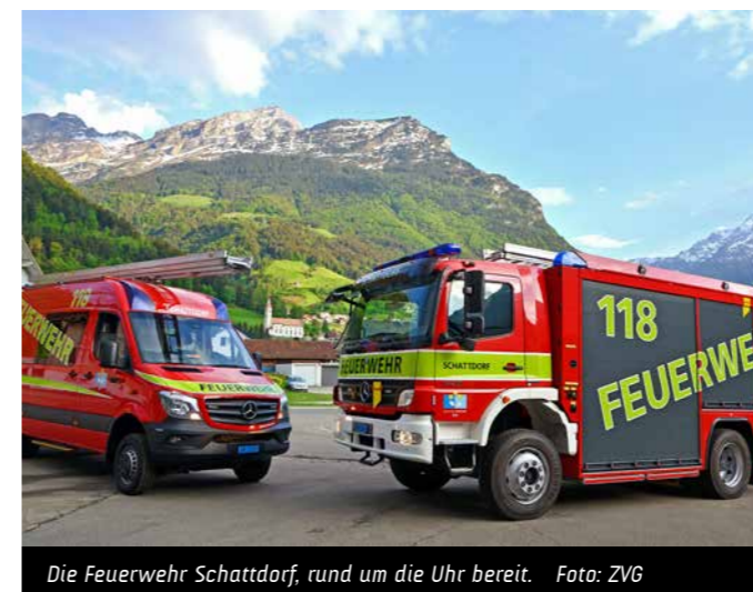
Die Feuerwehr Schattdorf, rund um die Uhr bereit.