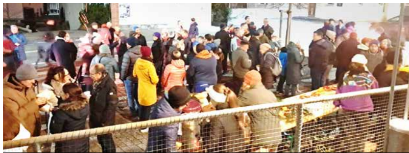
Mein Praxisauftrag in Aktion: Advents- Apéro organisieren.

Fürs KV beworben und das trotz Reform. Rückzug? Nein, ganz im Gegenteil: Angriff! Neue Strukturen, neue Begriffe, mehr Praxis, engere Verknüpfung von Schule, Betrieb und ÜK. Plötzlich ist die Lehre alles andere als altbekannt und ich mittendrin. Dieser Bericht gibt einen Überblick über die neue KV-Reform und zeigt auf, was sich aus der Sicht eines Lernenden im neuen System verändert hat.